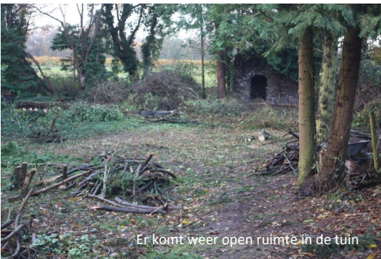
Er komt weer open ruimte in de tuin

Voor de realisatie van het plan voor de kloostertuin zullen we voor een groot deel zijn aangewezen op vrijwilligers uit het dorp. Gelukkig hebben we al een aardige groep mensen die wekelijks komen meewerken. Daarnaast willen we een beroep doen op plaatselijke vaklieden en ondernemers om tegen een laag tarief of beter nog om niet een bijdrage te leveren. Verder zijn we op zoek gegaan naar sponsors en hebben subsidie aangevraagd bij instellingen en fondsen. Wij zijn zeer verheugd dat van verschillende kanten reeds subsidie of een bijdrage is toegezegd. Het project hoeft ook niet in een keer helemaal af te zijn. Wat ons betreft mag het groeien in een tempo in overeenstemming met de voorhanden zijnde middelen en capaciteiten.