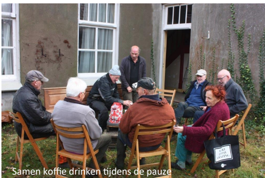
Samen koffie drinken tijdens de pauze

Op dit ogenblik is de werkgroep druk bezig om de zwaar verwilderde kloostertuin op te schonen. Grote, gevaarlijke coniferen zijn verwijderd. Verschillende ingestorte bouwsels in de tuin zijn afgevoerd. Er is flink gerooid, gesnoeid en opgeruimd. Langzaam maar zeker wordt steeds meer van een tuin zichtbaar.