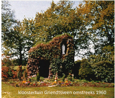
kloostertuin Griendtsveen omstreeks 1960

Qua organisatie maakt de werkgroep Kloostertuin onderdeel uit van de Dorpsvereniging Griendtsveen.