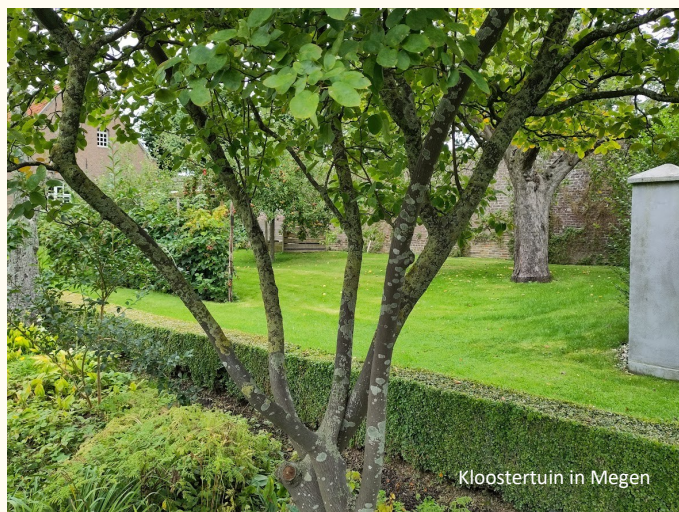
Kloostertuin in Megen