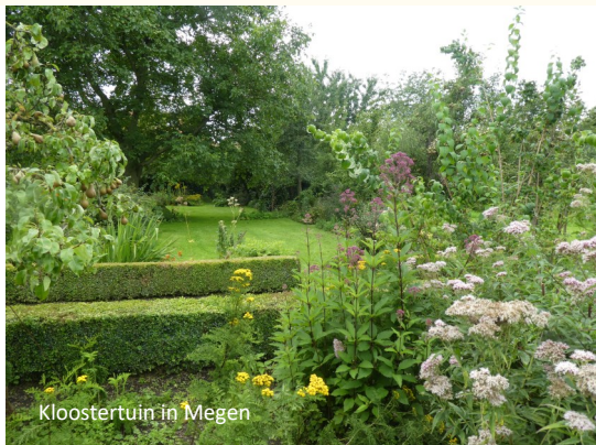
Kloostertuin in Megen

Met woningstichting WoonWenz die de appartementen in het klooster gaat verhuren willen we kijken of we ook de tuin rondom het kloostergebouw tegen een vergoeding kunnen gaan onderhouden. Dit levert dan ook enige financiële armslag op voor de Werkgroep Kloostertuin. Ook de woningstichting en de huurders zijn daar goed mee. Uiteraard zijn de huurders van harte welkom om in de Werkgroep Kloostertuin te participeren, maar daar wordt niet bij voorbaat van uitgegaan.