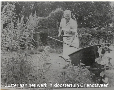
Zuster aan het werk in kloostertuin Griendtsveen

Het terrein van de kloostertuin is eigendom van verschillende eigenaren; de woningstichting, de gemeente, de basisschool en de parochie. Deels is deze eigendomsverhouding historisch zo gegroeid, deels is het een gevolg van de herbestemming van het kloostergebouw. Het is evident dat voor het behoud van de kloostertuin in zijn geheel het een voorwaarde is dat het beheer en onderhoud hiervan in één hand komt. De werkgroep kloostertuin is daarom druk doende om met alle eigenaren een overeenkomst te sluiten over een langdurig gebruik van de tuin.