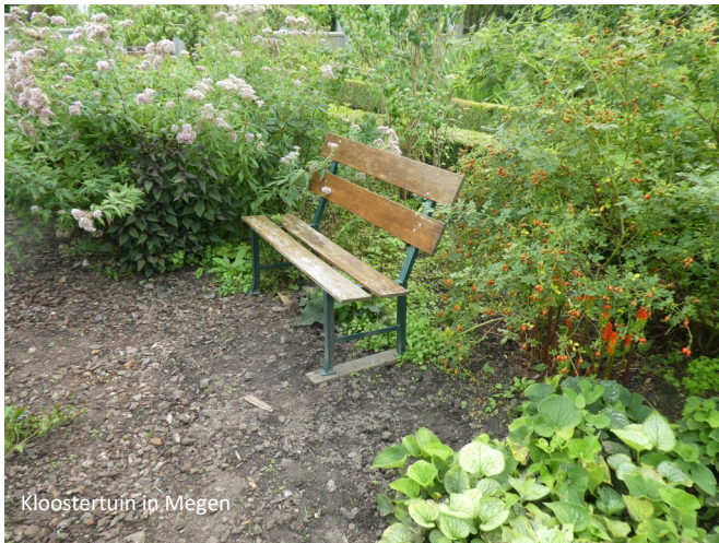
Kloostertuin in Megen