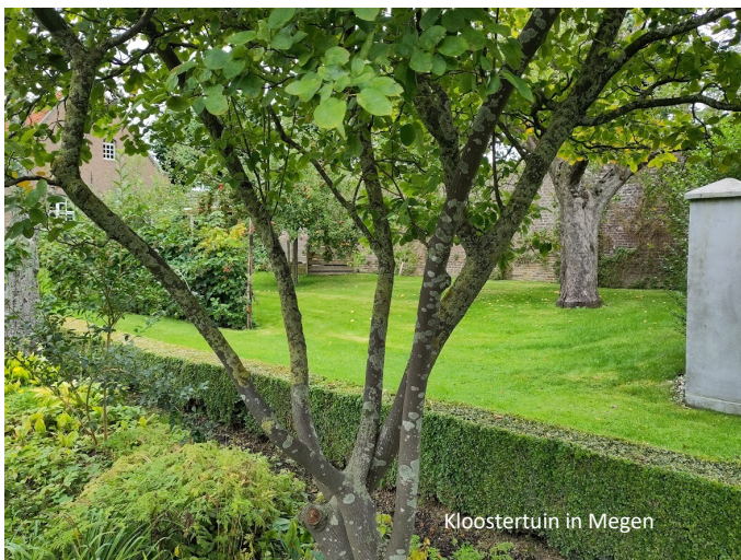
Kloostertuin in Megen