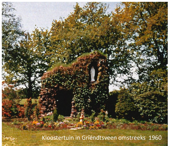
Kloostertuin in Gríéndtsveen omstreeks 1960

Het terrein van de kloostertuin zal straks in eigendom zijn van verschillende eigenaren; de woningbouwvereniging, de gemeente, de basisschool en de parochie. Deels is deze eigendomsverhouding historisch zo gegroeid, deels is het een gevolg van de herbestemming van het kloostergebouw. Het is evident dat voor het behoud van de kloostertuin in zijn geheel het een voorwaarde is dat het beheer en onderhoud hiervan in één hand komt. De werkgroep kloostertuin wil daarom met alle eigenaren een overeenkomst sluiten over een langdurig gebruik van de tuin.