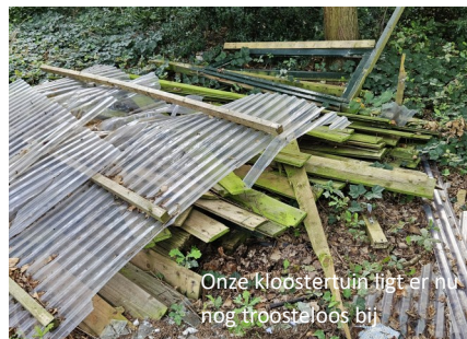
Onze kloostertuin ligt er nu nog troosteloos bij

Op dit ogenblik is de kloostertuin sterk verwilderd. Veel naaldbomen lopen tegen het eind van hun levensduur en vormen een gevaar voor het monumentale gebouw. Verschillende bouwsels in de tuin zijn compleet ingestort. Er zal flink gerooid, gesnoeid en opgeruimd moeten worden wil er weer iets van een tuin zichtbaar worden. Er is veel nieuwe aanplant nodig.