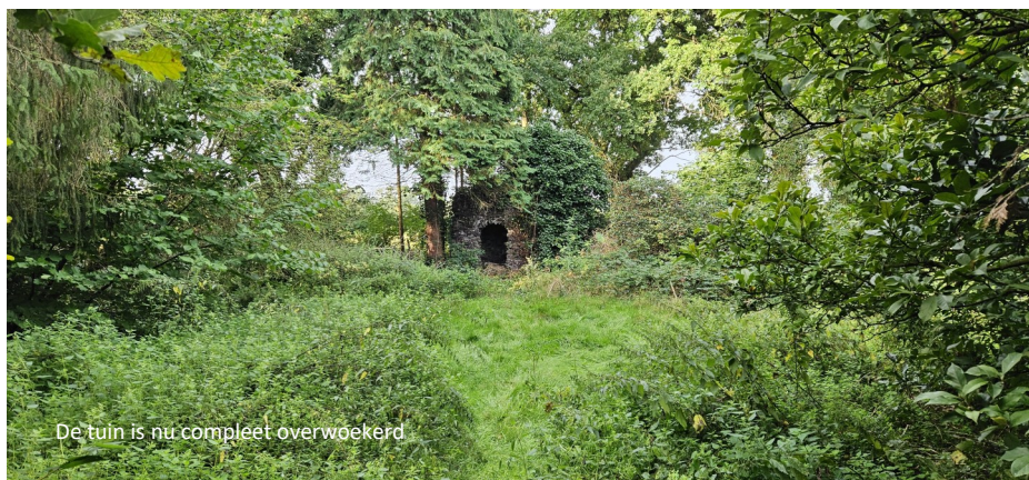
De tuin is nu compleet overwoekerd

Voor de realisatie van het plan voor de kloostertuin zullen we voor een groot deel zijn aangewezen op vrijwilligers uit het dorp. Verschillende hebben zich al bereid verklaard mee te willen helpen. Daarnaast zullen we een beroep doen op plaatselijke vaklieden en ondernemers om tegen een laag tarief of beter nog om niet een bijdrage te leveren. Verder zoeken we sponsors en vragen subsidie aan bij instellingen en fondsen. Het project hoeft niet in een keer helemaal af te zijn. Wat ons betreft mag het groeien in een tempo in overeenstemming met de voorhanden zijnde capaciteiten. Met woningbouwvereniging WoonWenz die de appartementen in het klooster gaat verhuren willen we kijken of we ook de tuin rondom het kloostergebouw tegen een vergoeding kunnen gaan onderhouden. Dit levert dan ook enige financiële armsgslag op voor de kloostertuingroep. Ook de woningbouwvereniging en de huurders zijn daar goed mee. Uiteraard zijn de huurders van harte welkom om in de kloostertuingroep te participeren, maar daar wordt niet bij voorbaat van uitgegaan.