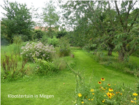
Kloostertuin in Megen

Het terrein van de kloostertuin zal straks in eigendom zijn van verschillende eigenaren; de woningbouwvereniging, de gemeente, de basisschool en de parochie. Deels is deze eigendomsverhouding historisch zo gegroeid, deels is het een gevolg van de herbestemming van het kloostergebouw. Het is evident dat voor het behoud van de kloostertuin in zijn geheel het een voorwaarde is dat het beheer en onderhoud hiervan in één hand komt. De werkgroep kloostertuin wil daarom met alle eigenaren een overeenkomst sluiten over een langdurig gebruik van de tuin.